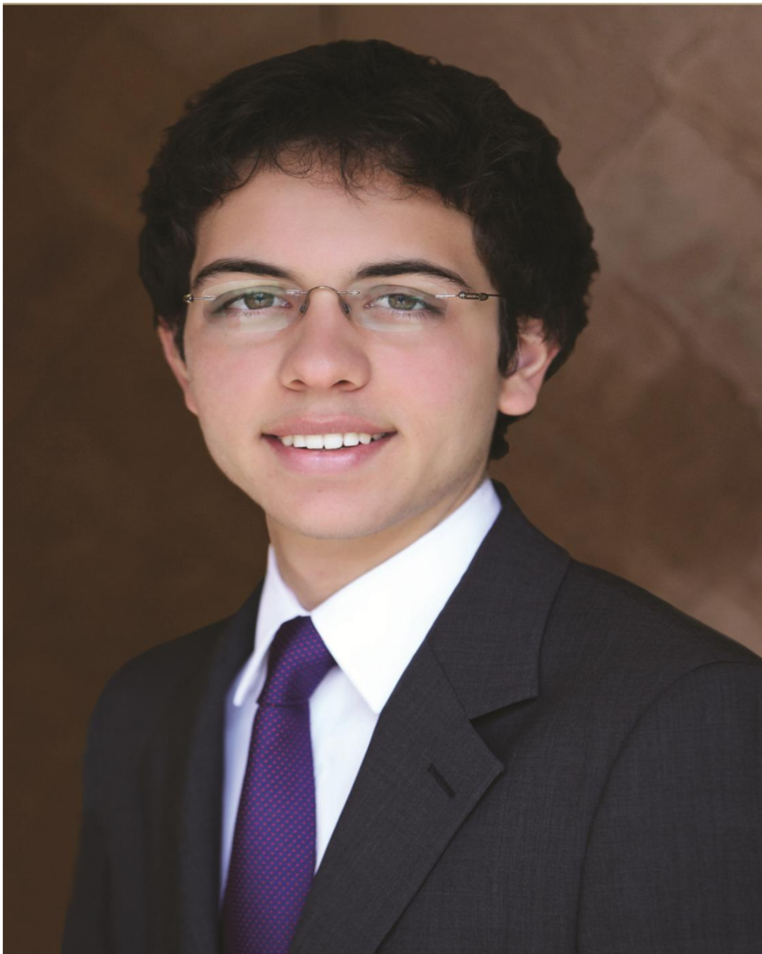
صاحب السمو الملكي الأمير حسين بن عبد الله الثاني ولي العهد المعظم