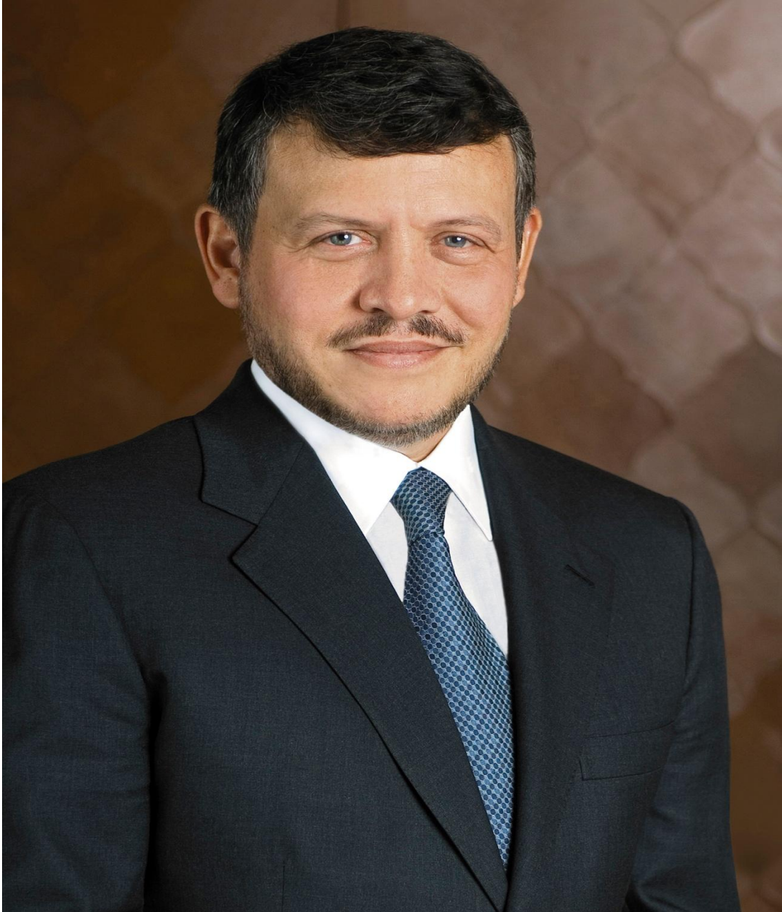
حضرة صاحب الجلالة الملك عبد الله الثاني ابن الحسين المعظم