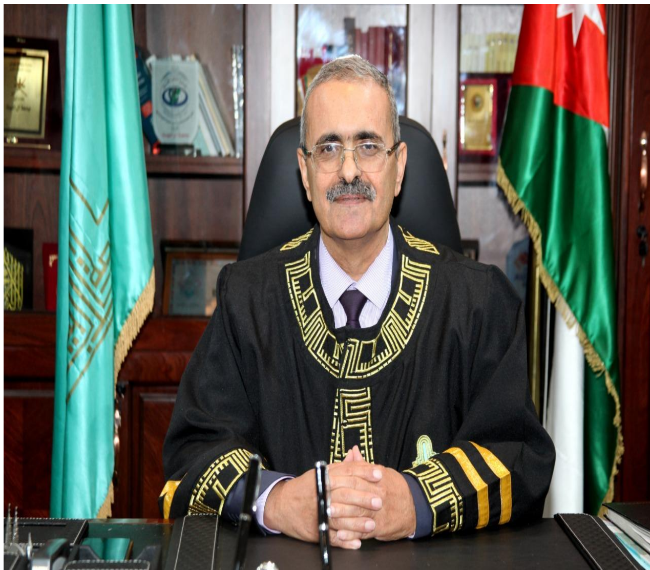
عطوفة الأستاذ الدكتور هاني الضمور رئيس جامعة آل البيت