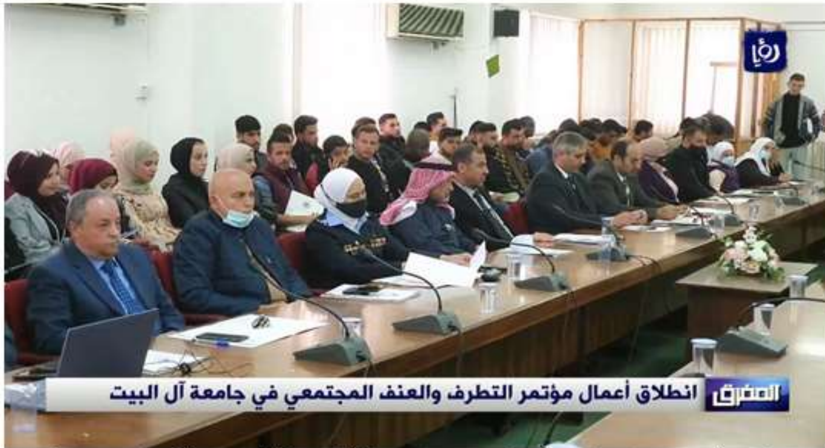
الشرق انطلاق أعمال مؤتمر التطرف والعنف المجتمعي في جامعة آل البيت

بهدف التوعية من مخاطر العنف في المجتمع نظمت كلية الشريعة في جامعة آل البيت مؤتمراً يبحث في أسباب، ومواجهة التطرف والعنف المجتمعي.