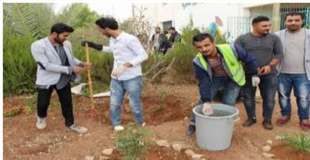
Reducing carbon emissions by planting more trees