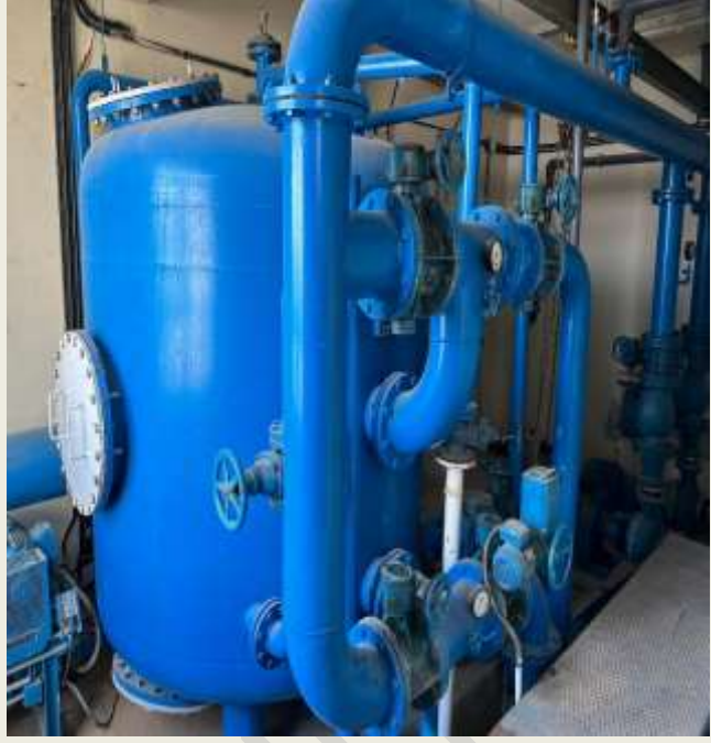
توفير أجهزة الفلترة والتعقيم لمياه المسبح.